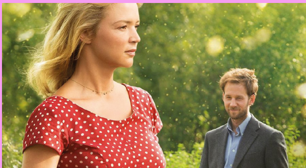
Image issue de l'affiche du film Le goût des merveilles

Organisé par la Nef des sciences, l'Inserm Est et l'association Sinclair.